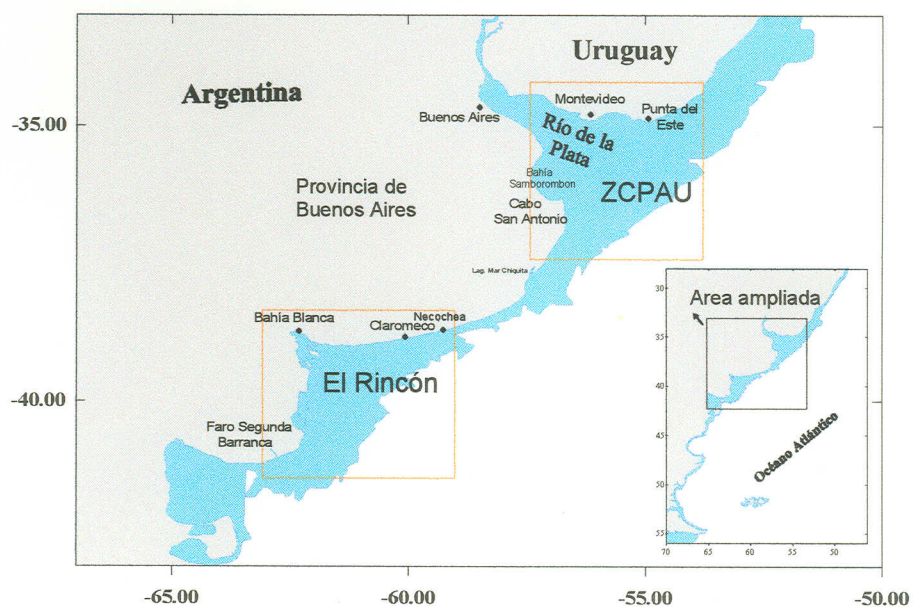
Figura 1: Ubicación geográfica del área estudiada.

En estos dos sistemas oceanográficos costeros identificados se localizan frentes térmicos y salinos a los que se asocian concentraciones reproductivas, zonas de puesta y cría de especies costeras (Lasta, 1998; Guerrero, 1998).